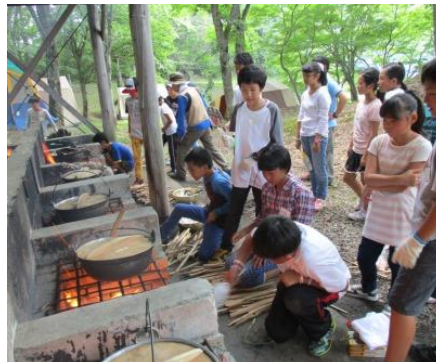
カレーライス作り