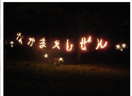
火文字 (なかま × しぜん)