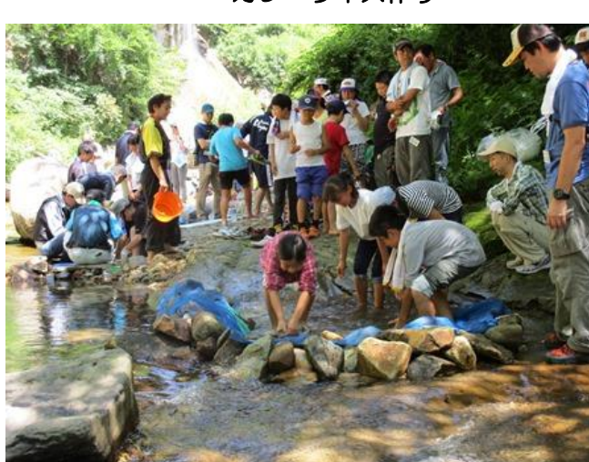
紅葉川溪谷で、元気にマスつかみです