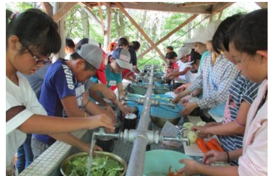
みんなで野菜切りです