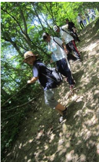
面白山への散策路