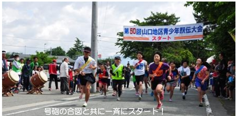
号砲の合図と共に一斉にスタート!