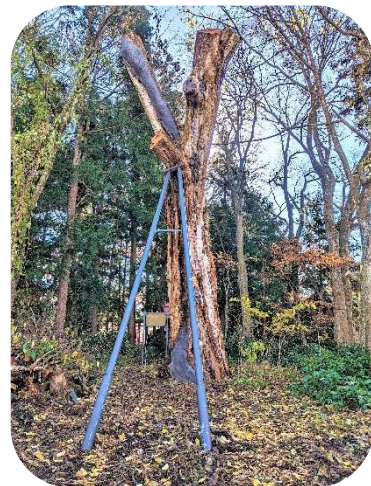
↑ 伐採した枝と支柱が撤去された様子

市天然記念物にも指定されていた小原のイヌザクラは「藤蔵稲荷」と呼ばれる稲荷神社の境内にある樹高20m、根回り5.75mの大木の稀に見る樹種で、本県最北の分布地としては最大の大変貴重なものでした。また、イヌザクラだけでなく大木の幹を伝わって伸びている蔓性のツルマサキも珍しい植物とされていました。